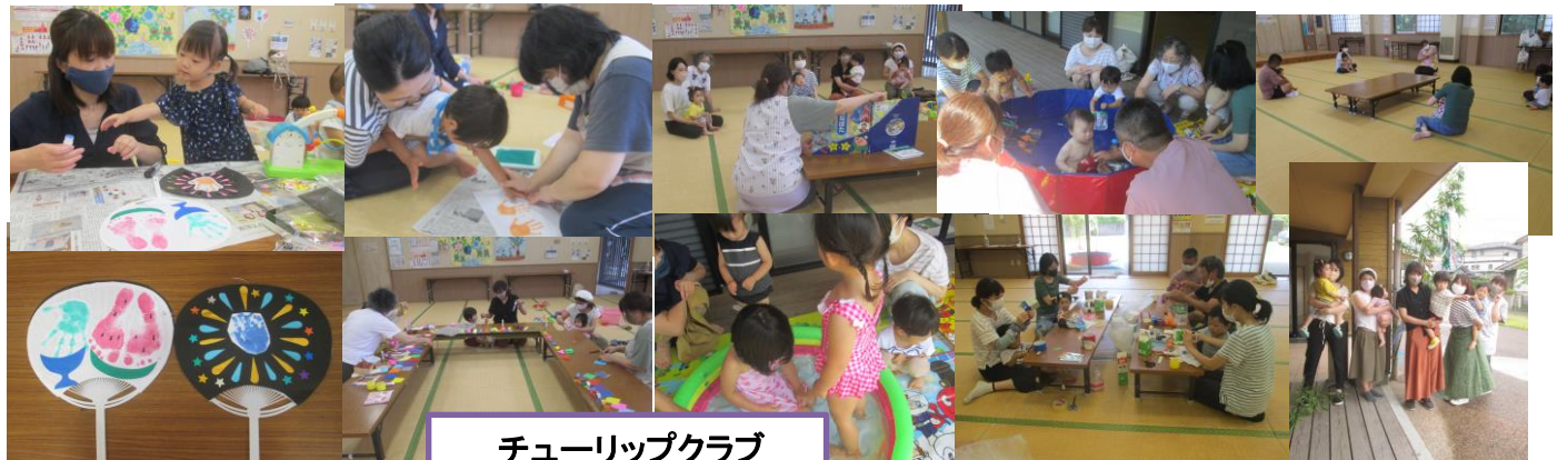
チューリップクラブ