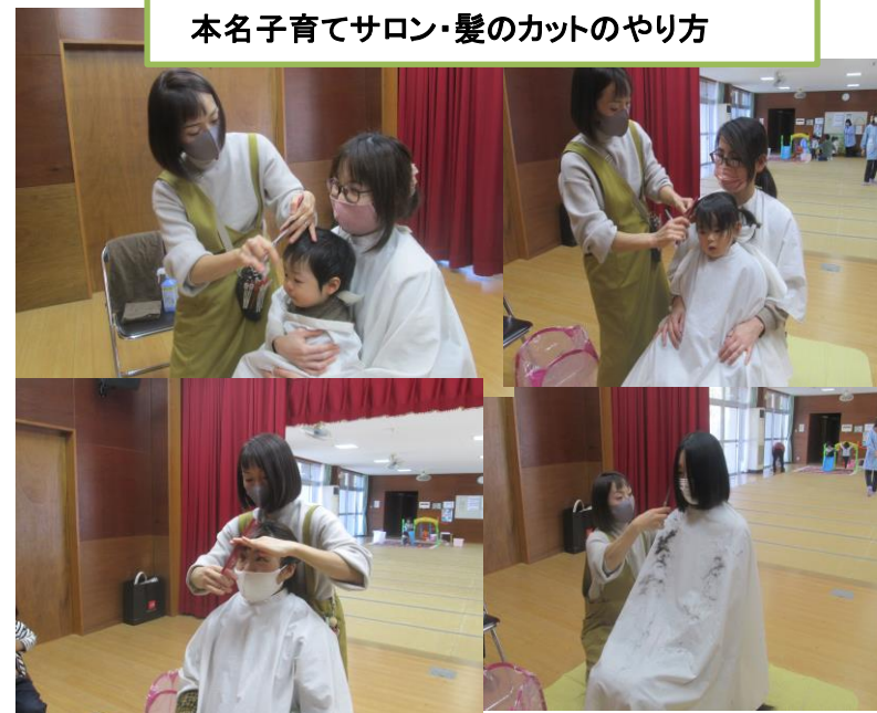
本名子育てサロン・髪のカットのやり方