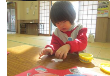
チューリップクラブ ひな祭り製作