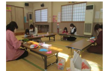
牟礼岡子育てサロン ひな祭り製作