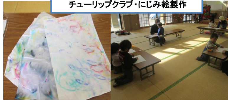
チューリップクラブ・にじみ絵製作