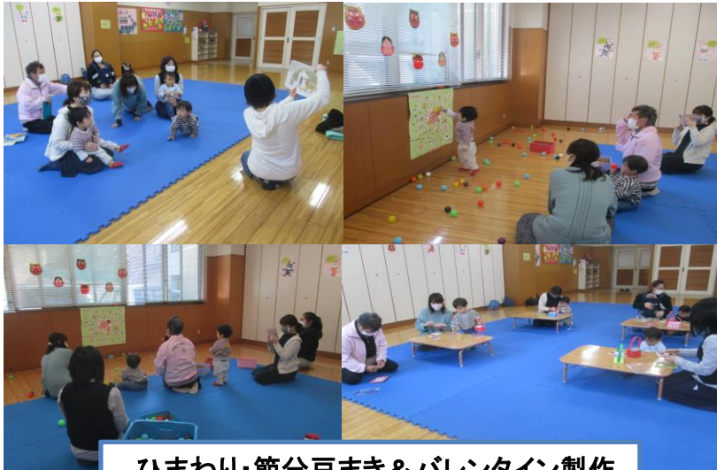
ひまわり・節分豆まき&バレンタイン製作