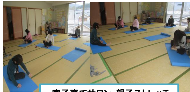
宮子育てサロン・親子ストレッチ