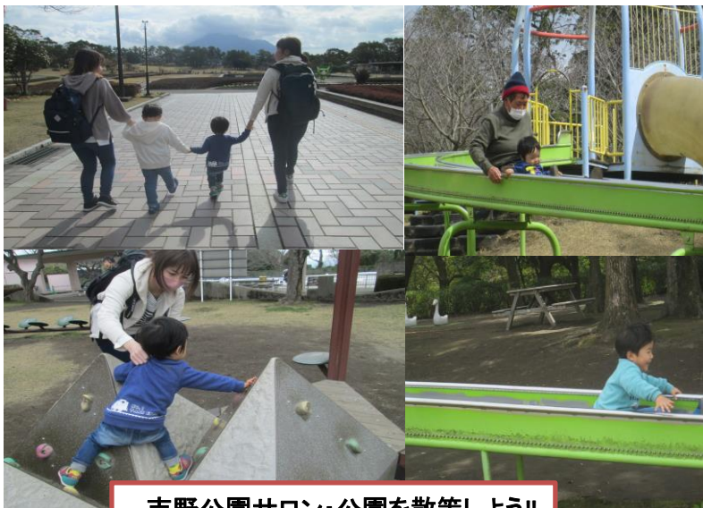
吉野公園サロン・公園を散策しよう!!