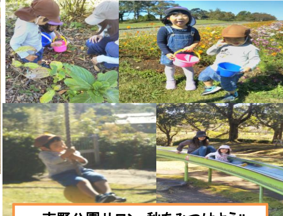
吉野公園サロン・秋を見つけよう!!