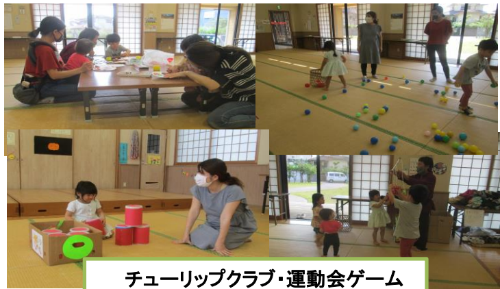
チューリップクラブ・運動会ゲーム