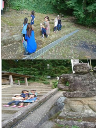
本名子育てサロン・神社へ散