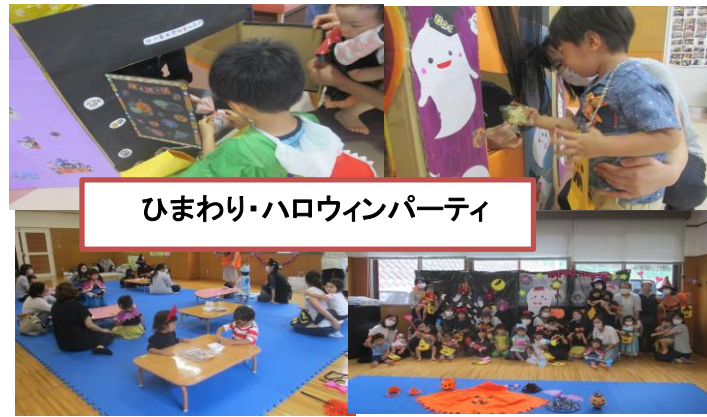
ひまわり・ハロウィンパーティ