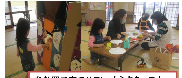
牟礼岡子育てサロン・もうすぐハロウィン