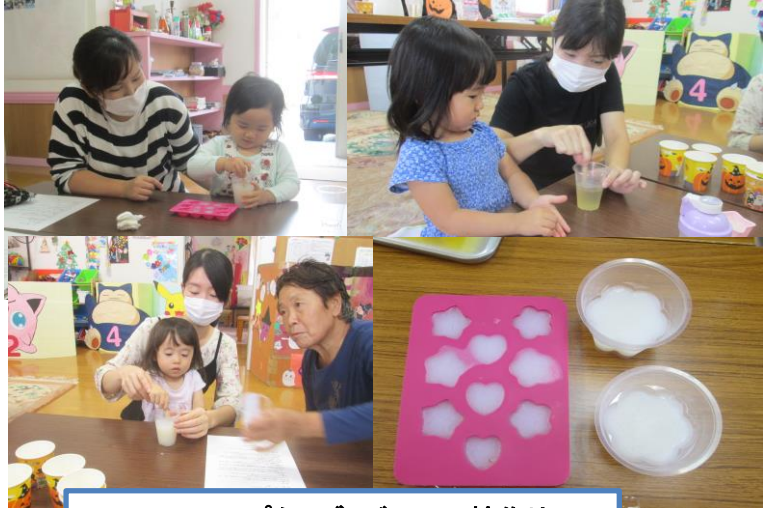
チューリップクラブ・ゼリー石鹸作り