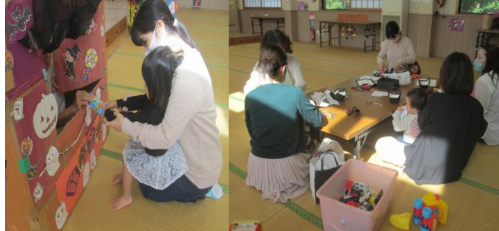
チューリップクラブ・ハロウィンパーティ