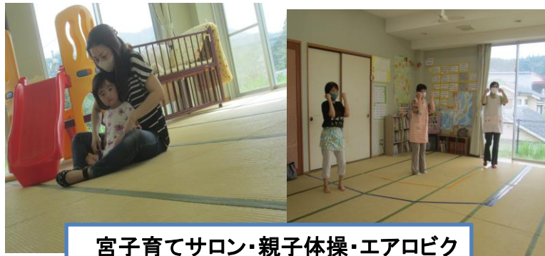
宮子育てサロン・親子体操・エアロビク