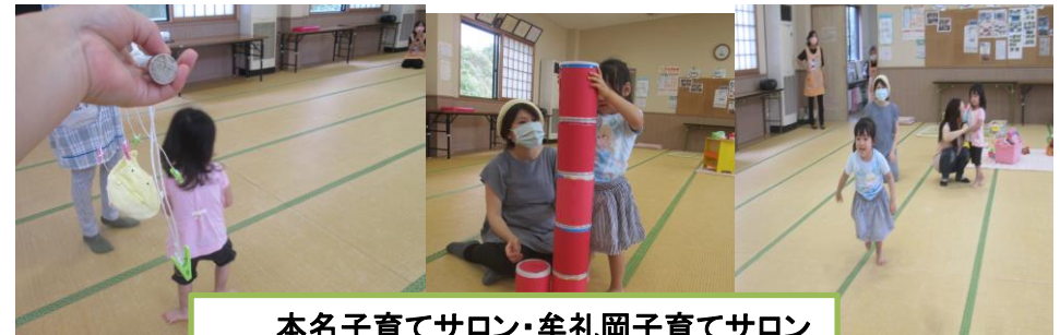
本名子育てサロン・牟礼岡子育てサロン ミニミニ運動会