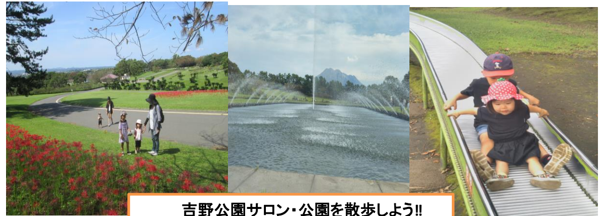
吉野公園サロン・公園を散歩しよう!!