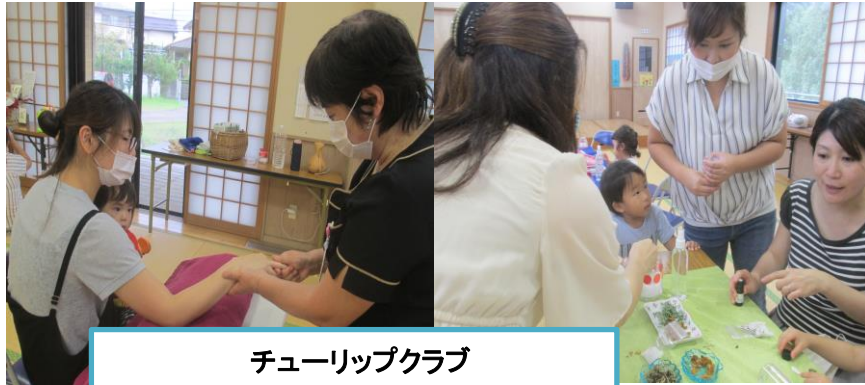
チューリップクラブ