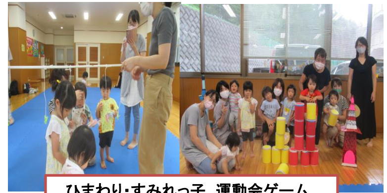
ひまわり・すみれっ子 運動会ゲーム