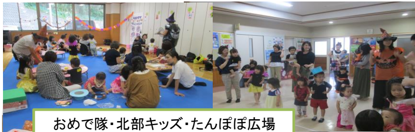
おめで隊・北部キッズ・たんぽぽ広場