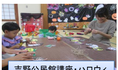
吉野公民館講座・ハロウィ