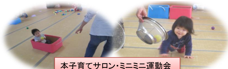
本子育てサロン・ミニミニ運動会