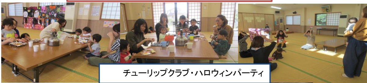
チューリップクラブ・ハロウィンパーティ