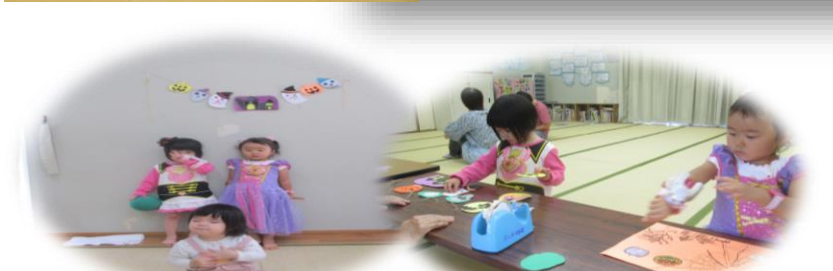
宮子育てサロン・ハロウィン