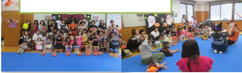
牟礼岡子育てサロン・ハロウィ